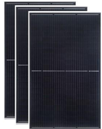
Q-cells DUO solpanel