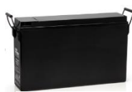
Lead Crystal Batteri